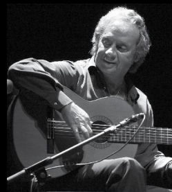
Victor Monge "Serranito"